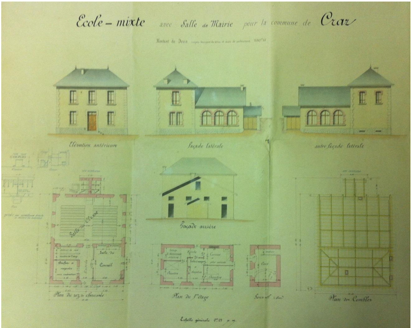
Figure 2 - Plan de l'école de Craz, M3 (1873).