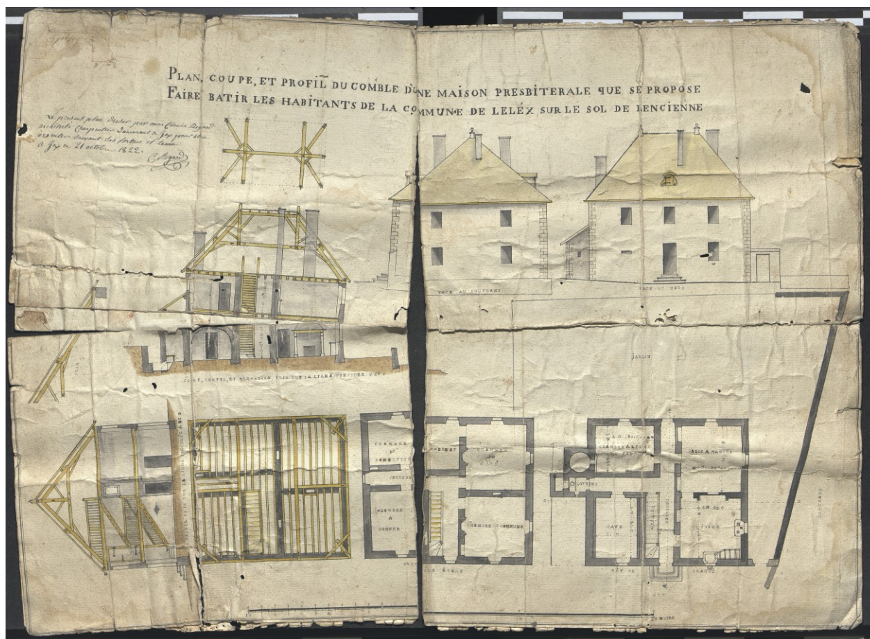
Figure 1 – 2M2 bis, plan du presbytère de Lélex, 21 octobre 1822.

Nota : La cote 2M2bis contient les plans des bâtiments et du cimetière, conditionnés à plat.