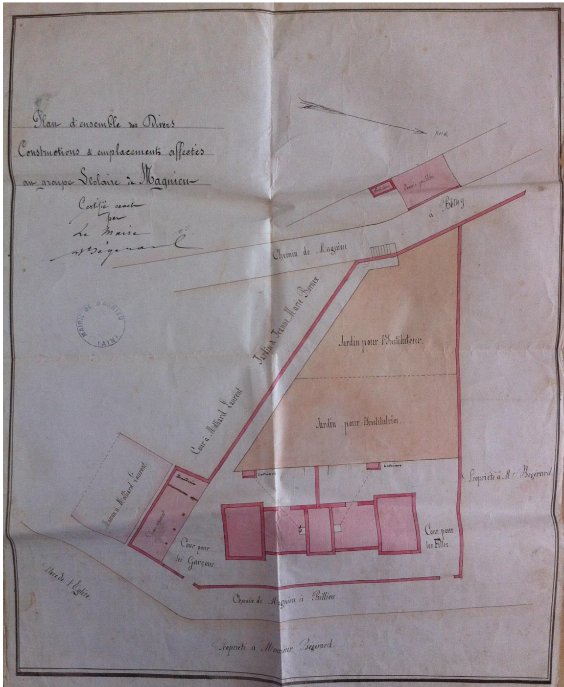
Figure 3 Plan de l'emplacement du groupe scolaire, 1880 (M1)